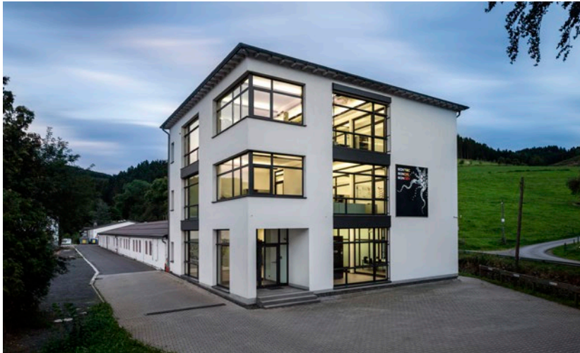
Das SONTEC-Gebäude für Entwicklung, Vertrieb und Verwaltung.

Wünschen Sie weitere Informationen zum Unternehmen oder hochauflösende Bilder, freuen wir uns von Ihnen zu hören!